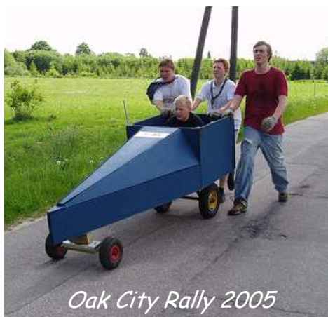
Oak City Rally 2005

Vi skal også på Oak City Rally, hvor vi helt selv skal bygge vores egen sæbekassebil og prøve den af, selvfølgelig.